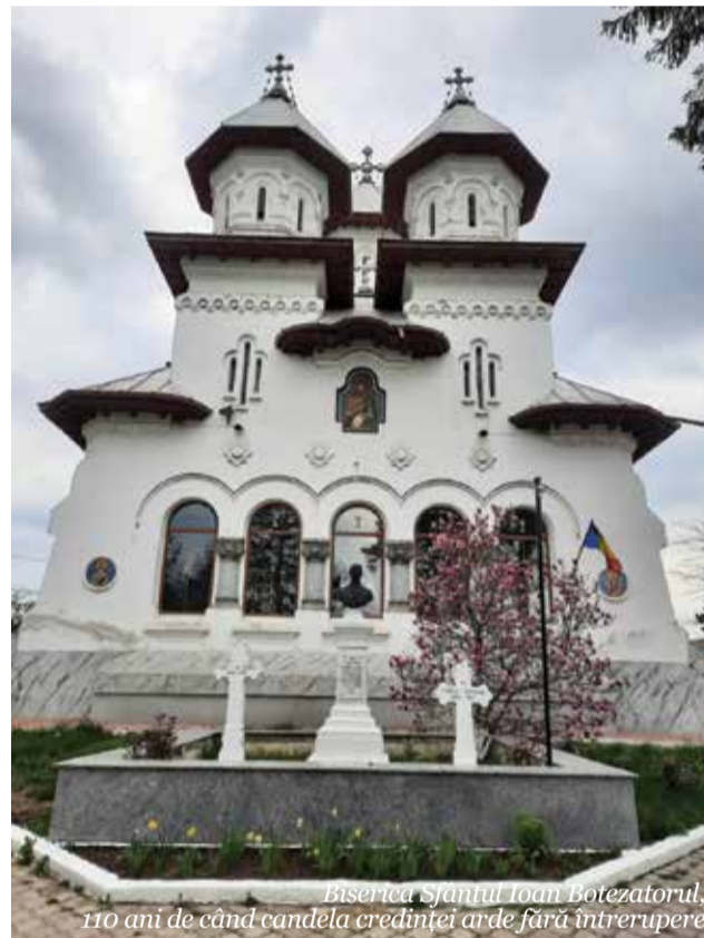
Biserica Sfântul Ioan Botezătorul, 110 ani de când candela credinței arde fără întrerupere

În relatarea pe care a făcut-o în Faptele Apostolilor, Sfântul Evanghelist Luca redă într-o descriere mai detaliată faptul Înălțării Domnului la cer, aducând noi amănunte privind acest eveniment. El spune că, după ce a petrecut cu ei timp de 40 de zile de la Învierea Sa, le-a poruncit să nu părăsească Ierusalimul (Fapte 1, 4-5), ci să aștepte Pogorârea Sfântului Duh, pentru a deveni martorii Lui până la marginile pământului.