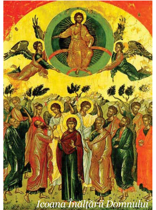
Icoana Înălțării Domnului

Această sărbătoare nu a fost aleasă întâmplător de Biserică drept zi de pomenire a eroilor, pentru că există o legătură tainică