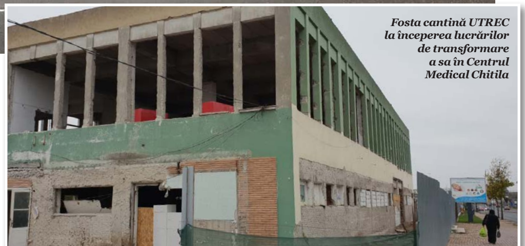
Fosta cantină UTREC la începerea lucrărilor de transformare a sa în Centrul Medical Chitila