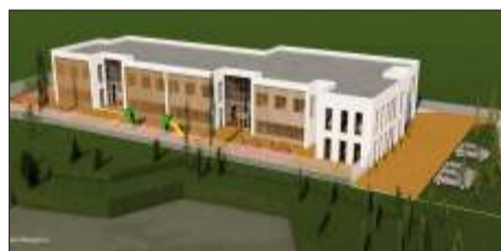
Centrul Medical Multidisciplinar Chitila

Grădinița pentru micii chitileni Administrația locală va da în 2018 și startul unui nou proiect destinat educației copiilor: construcția unei noi grădinițe realizată la cele mai înalte standarde europene. Grădinița va avea la parter patru săli de clasă, iar la etaj două, toate modulare și dotate cu grup sanitar propriu, va avea alveole de joacă și un spațiu multifuncțional, apoi o curte cu spații pentru joc, recreație și sport. Sunt incluse spații pentru cabinetul medical, vestiare, sala de mese, apoi dormitoare, amplasate la etaj, cu acces la grupuri sanitare și tot la etaj o terasă de joacă cu suprafața de peste 130 mp și încă un spațiu multifuncțional de aproape 150 mp. Toate spațiile interioare vor avea aer condiționat încadrat și va fi asigurată și ventilarea naturală. Documentația se va depune pentru solicitarea finanțării și va urma curând licitația pentru începerea execuției lucrării.