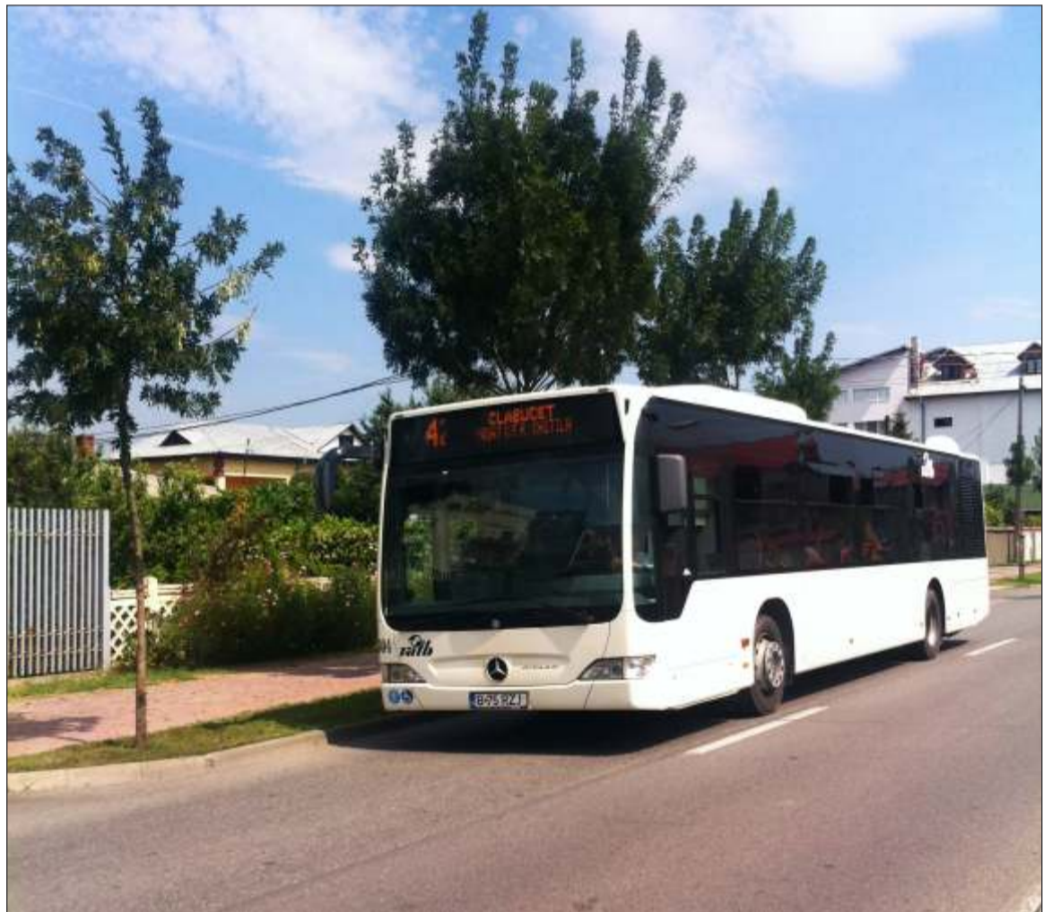
În acest moment, singura linie de transport în comun care leagă Chitila de București este cea de autobuz, numărul 422

S-au identificat și principalele probleme care afectează transportul în comun din Ilfov. Cele mai importante țin de frecvența autobuzelor, de operatorii multipli care sunt pe aceeași rută, de starea precară a stațiilor de autobuz, de aglomerația din orele de vârf, de plata multiplă a unui drum spre București în momentul când călătorii se transferă de la maxi-taxi la liniile RATB sau la metrou, de schema de prețuri care nu ține cont de distanța parcursă, de lipsa subvențiilor.