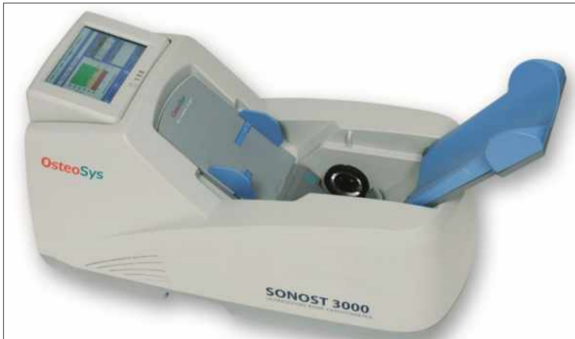
Aparatul de screening al densității osoase

Osteodensitometria constă în măsurarea densității osoase și aprecierea calității osului.