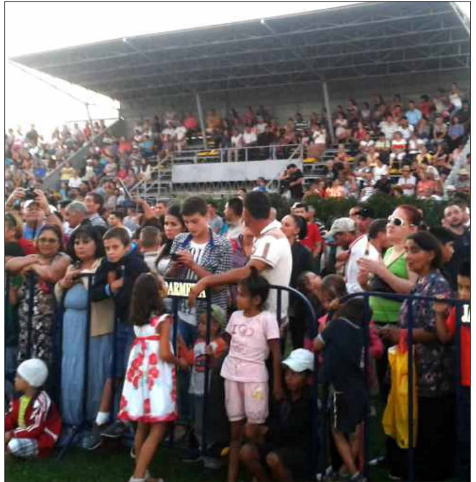
Peste 3000 de locuitori ai Chitilei au participat la sărbătoarea de pe 30 august

De asemenea, a avut loc și un moment dedicat tinerelor talente din Chitila, iar sărbătoarea s-a încheiat cu un fascinant joc de artificii, care i-a încântat pe cei prezenți.