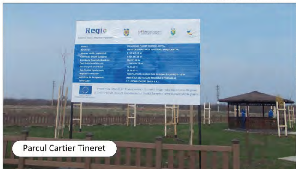
Parcul Cartier Tineret