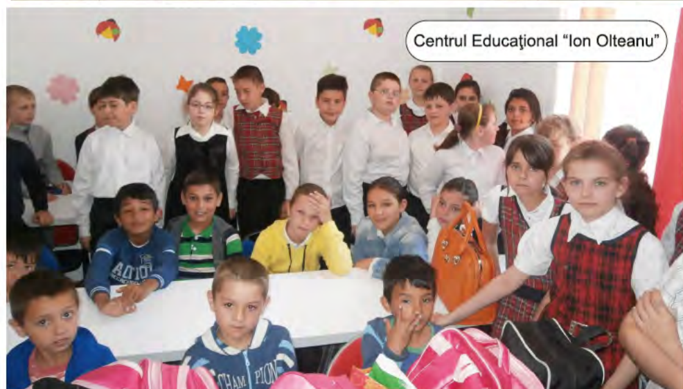
Centrul Educațional "Ion Olteanu"