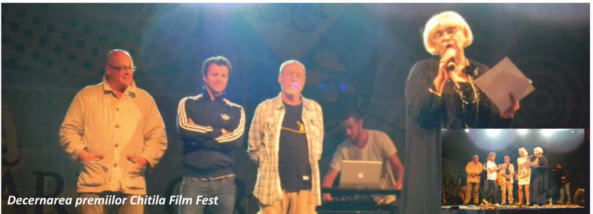
Decernarea premiilor Chitila Film Fest

organizat de Primăria Chitila, trei zile care au adus chitilenilor bucurie și un motiv în plus de mândrie că locuiesc în acest oraș.