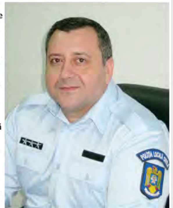
Șeful Poliției Locale Florin Iordan

caracter privat și utilizarea de aparatură muzicală la o intensitate de natură să tulbure liniștea locuitorilor, în corturi, alte amenajări sau în spații neacoperite, situate în perimetrul apropiat imobilelor cu destinația de locuințe sau cu caracter social, în mediul urban, se sancționează cu amendă de până la 1.500 lei. Poliția Locală are misiunea de a menține liniștea și ordinea publică a orașului și nu de a aplica sancțiuni, dar în cazul constatării unor încălcări ale normelor în vigoare, va aplica amenzi persoanelor vinovate. Fiți conștienți de consecințele actelor dumneavoastră!