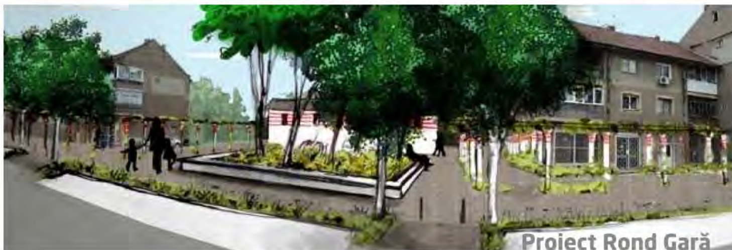
Proiect Rond Gară

Am reușit să atragem fonduri europene în valoare de 21 milioane euro pentru sistematizarea orașului, iar pentru acest lucru îi mulțumesc echipei Primăriei Chitila pentru profesionalismul de care a dat dovadă. Înființarea unei policlinici a fost un proiect pentru care nu am avut fondurile necesare în condițiile crizei economice și a faptului că nu există fonduri europene pentru