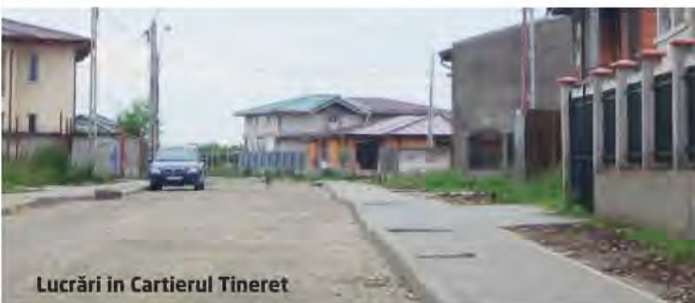
Lucrări în Cartierul Tineret