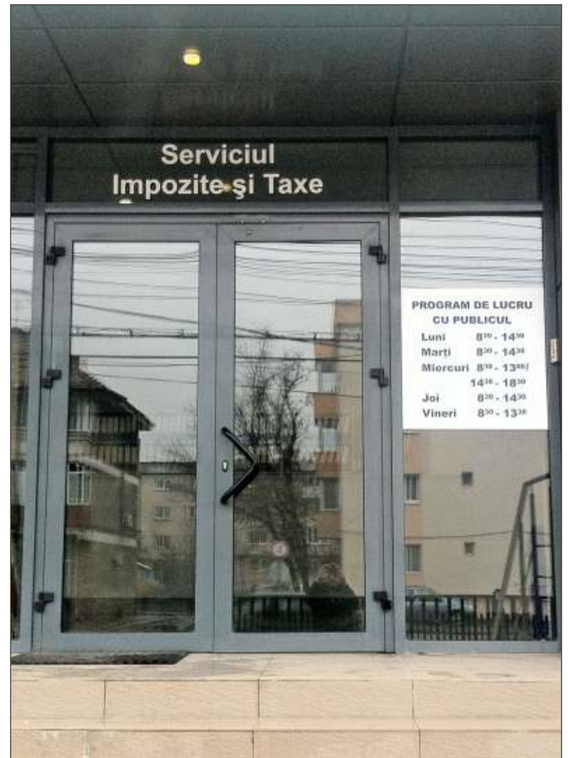
„Serviciul Impozite și Taxe“ s-a mutat într-un sediu nou pe Șoseaua Banatului 109A, programul cu publicul fiind cel din imaginea de mai sus

Persoanele care locuiesc și gospodăresc împreună la o adresă din orașul Chitila și care nu au depus declarația de salubritate au obligația de a depune respectiva declarație în termen de 30 de zile de la data la care locuiesc în orașul Chitila.